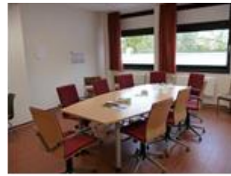
Besprechungsraum 2.OG (35m 2 )