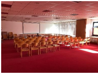
Tagungsraum 1.OG (250m 2 )