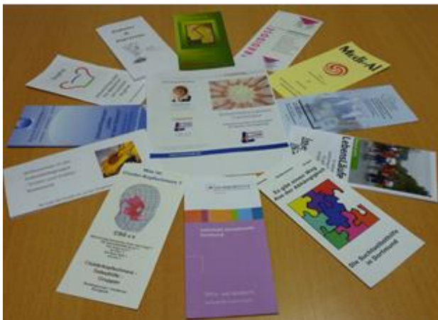
Inhalt der ausliegenden Info-Mappen