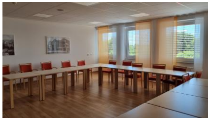
Besprechungsraum 3.OG (40m 2 )